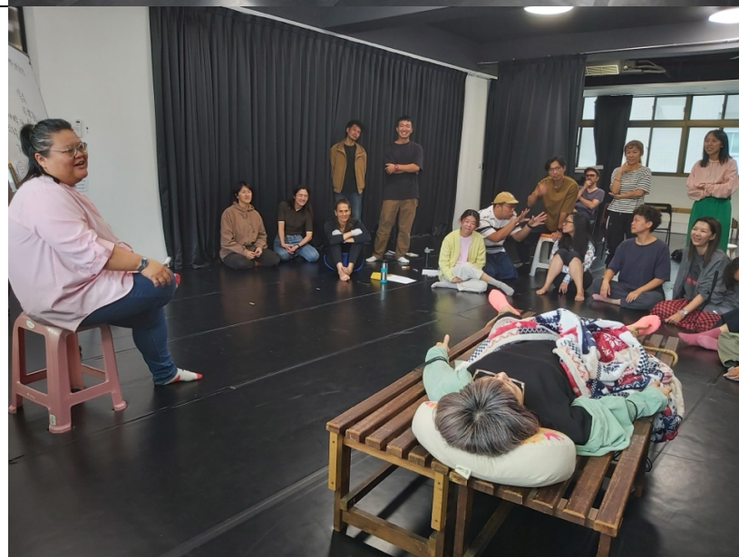
主題課程-為身心障礙者 表演