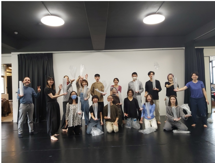
主題課程-雜耍概論