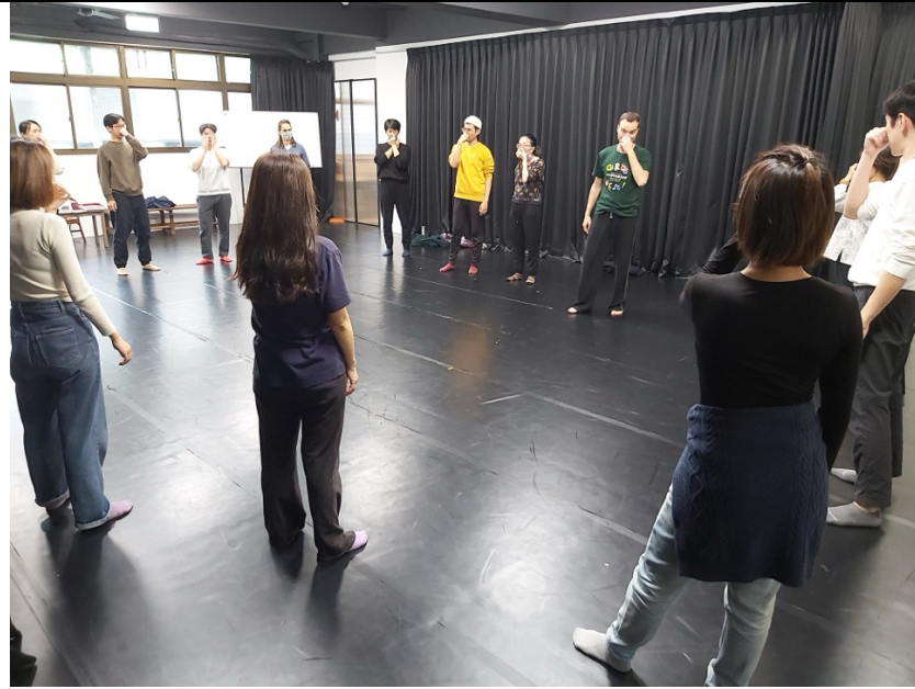
主題課程-身體節奏